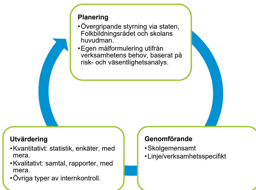
Figur 4: Modell för Kävsta folkhögskolas systematiska kvalitetsarbete.

Skolans systematiska kvalitetsarbete grundar sig på ett cykliskt arbetssätt där ledningen tillsammans med personal a) planerar, b) genomför och c) utvärderar verksamheten. Denna verksamhetsplan beskriver de övergripande mål som gäller för skolan som helhet, samt hur dessa ska utvärderas och följas upp. Uppföljningen sker i en skolgemensam verksamhetsberättelse som görs en gång per år. Utifrån uppföljningen kan skolan eventuellt revidera befintliga mål eller definiera nya till nästa års verksamhetsplan. Verksamhetsplan och verksamhetsberättelse beslutas årligen av skolans styrelse och rapporteras till Folkbildningsrådet.